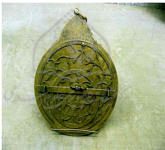
شکل (۴)