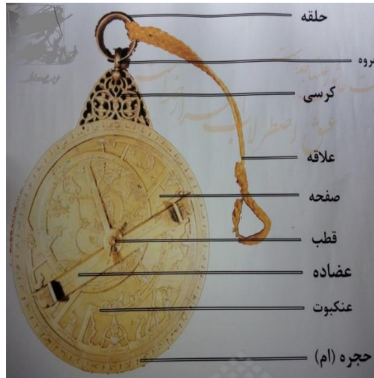
شکل (۱) طرح کلی از اسطرلاب و اجزای تشکیل دهنده آن