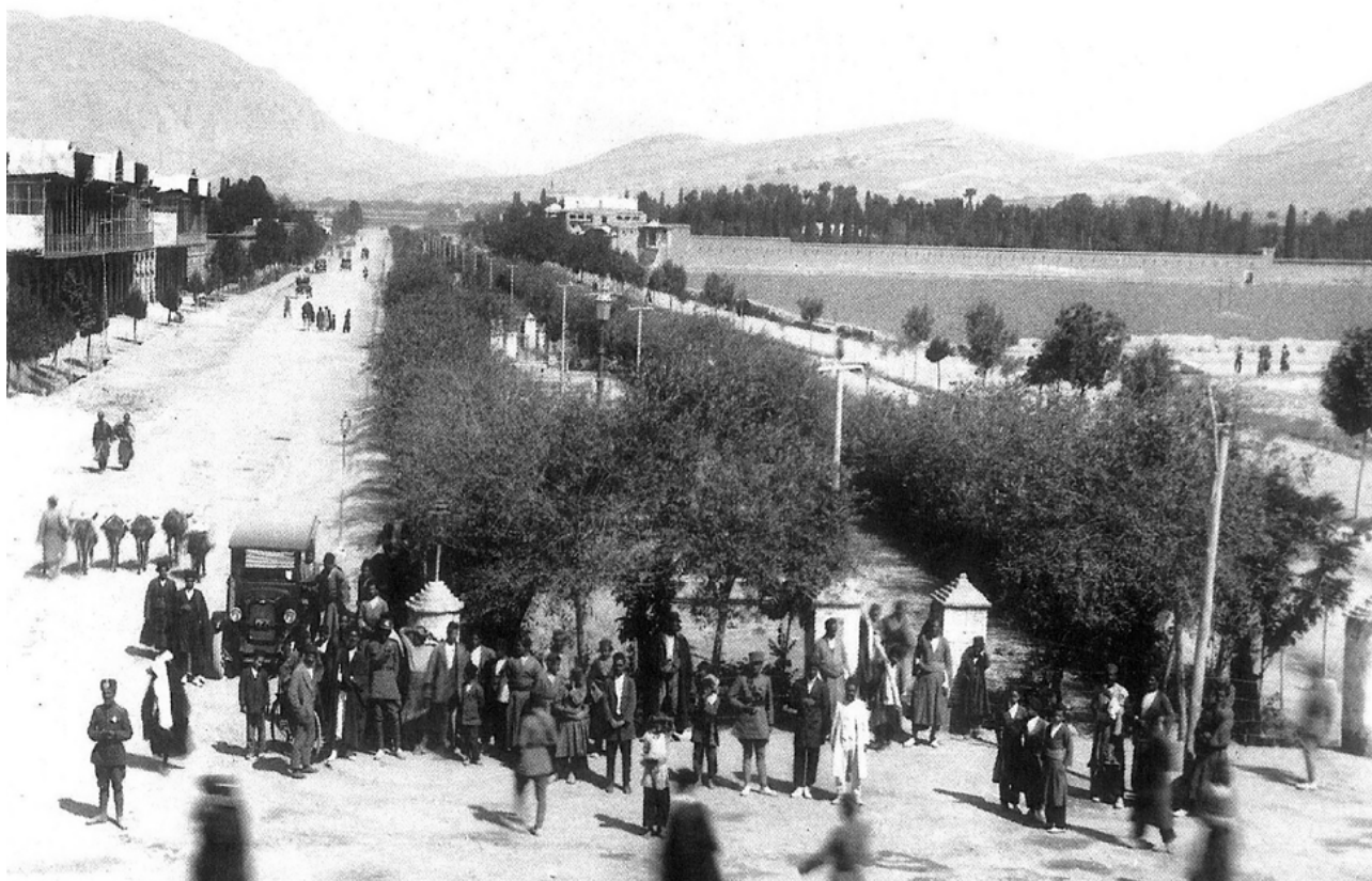
تصویر ۴: نمای باغ-محور غرب شهر منتهی به باغ شاه، دوره زندیه.

تحلیل چگونگی نظام استقرار باغ در سازمان فضایی شهر مطابق نمودار ۱، تعامل باغ و شهر یک تعامل دوسویه است.