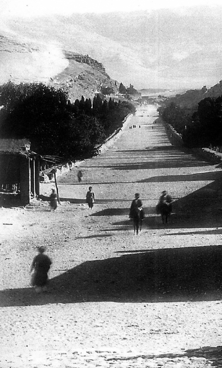
تصویر ۳: نمای باغ - محور شمالی شهر منتهی به دروازه قرآن، دوره قاجاریه. مأخذ: صانع، ۱۳۸۰.

پس از سقوط صفویه تا به قدرت رسیدن زندیه در سال ۱۱۸۰ ه.ق.، شیراز در اثر یک سیل مدحش و خانه‌برانداز، دچار ویرانی‌های زیادی شد. در سال ۱۱۳۶ ه.ق. به دست سرداران و سربازان محمود افغان افتاد و سرانجام در سال ۱۱۵۷ ه.ق. به وسیله سرداران اعزامی از سوی نادرشاه محاصره شد و باغ‌ها و درختان میوه بیرون از شهر همه از بین رفتند. به‌طور کلی در عرض یک‌صد سال، نه‌تنها هیچ آبادانی در شهر انجام نگرفت، بلکه آبادانی‌های فراوان زمان صفویه هم از بین رفت (سامی، ۱۳۶۳: ۵۰۸). کریم‌خان که از سال ۱۱۸۰ ه.ق. به عمران و آبادانی شهر پرداخت، ابنیه حکومتی خود را غالباً در باغ‌های ویران شده احداث کرد. تأسیسات کریم‌خان در حول